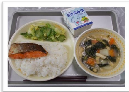
給食の始まりにちなんだ塩鯖とご飯

1月末の一週間は給食の大切さを考え、食への感謝の気持ちを持つ全国学校給食週間となっています。ところで給食の歴史は約130年前のこと。山形県で出された「おにぎり、焼き鮭、菜の漬物」の献立が学校給食の始まりとされています。横須賀市でも、この週に「煮込みうどん、揚げパン、カレー、サケの塩麴焼き」など、給食の歴史をなぞる、おいしい献立が提供されました。