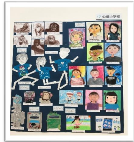
素敵な作品いっぱい 夢いっぱい

白い壁、素敵な空間に、子ども達の作品が飾られました。見ごたえも抜群。ゆっくり歩きながら、公郷小の子ども達の作品を探す楽しみがいっぱいでした。加えて、市内の小中学校、総合高校の素晴らしい作品からも、感動がたくさん得られました。1月中に開催された恒例の展覧会。ゆっくり芸術に浸るひと時になりました。