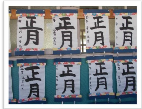
3年生 一筆一筆思いを込めました

年末にも練習を重ねた書初め。「明るい心」(4年)「新しい風」(5年)、「将来の夢」(6年)の大作が勢ぞろいしました。また、3年生は筆を使って書くことの楽しさも感じられるようになった初めての書き初め。新年の楽しかった出来事も思い浮かべて「正月」を記しました。低学年も「初日の出」「お雑煮」にちなんだお話を硬筆で、一文字一文字しっかりと書き表しました。